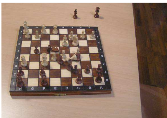
Pečlivě připravená varianta – oběť bílého jezdce v královském gambitu (zůstává nepoužito)

Vrátila se nadšená s naučenou variantou krásné oběti bílého jezdce v královském gambitu. Sice jsem příliš nevěřil, že na tuto konkrétní variantu dojde, ale několikrát jsme si ji zopakovali, jelikož se někdy určitě bude velmi hodit. Její dobrá nálada po přípravě mě ještě více utvrzovala v naději prvního kladného zápisu do výsledkové listiny.