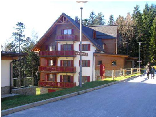
Hotel Bona, Bolfenk 11, my bydlíme v podkroví