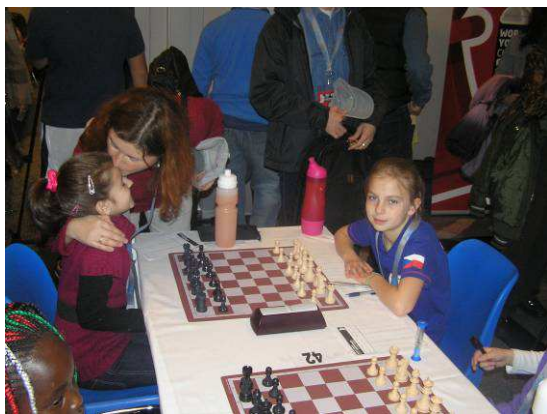
Soupeřka s maminkou