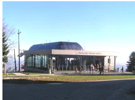
Stanice hlavního dopravního prostředku, lanovka Mariborsko Pohorje