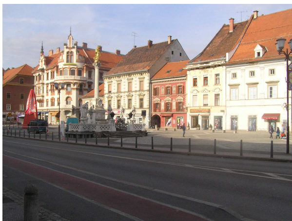
Historické centrum Mariboru