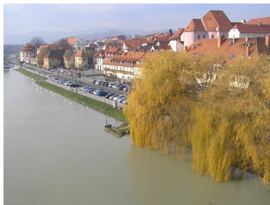
Rozlučka s Mariborem na břehu a z pohledu na břeh řeky Dravy