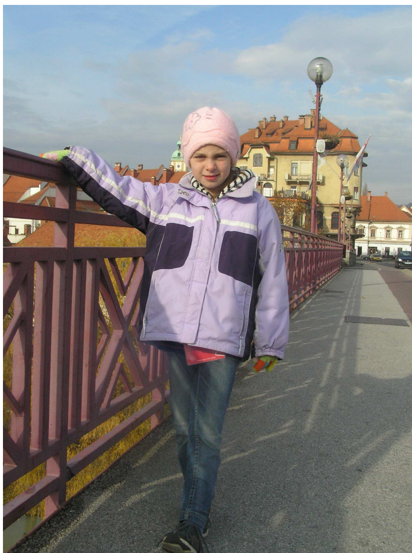
Poslední fotka na mostě nad řekou Dravou – nashledanou a díky!