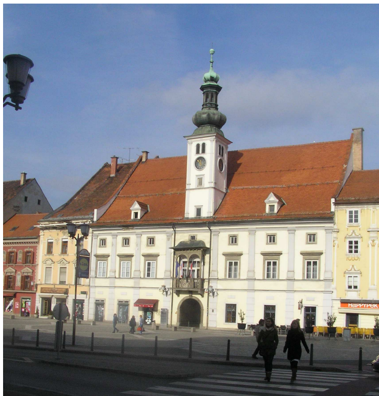
Historické centrum Mariboru