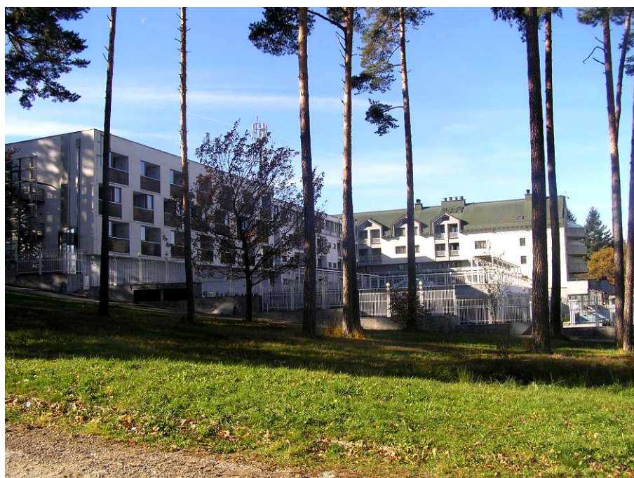
Hotel Habakuk - okolí

Po asi hodinové procházce po okolí hotelu a sjezdovek a Aniččině rozcvičce na místním hřišti jsme se rozhodli vrátit lanovkou nahoru. Jenže ta měla odjezd až za cca 40 minut, přestávku Anička vyplnila řešením několika diagramů na mém mobilu, já jsem ochutnal místní točené „Laško“-no bylo to o něco lepší než lahvové včera večer..., ale pořád zlaté domácí Starobahno. Zde se setkávám konečně s funkční wifí (v apartmánu bohužel setrvalý stav), ale Aniččinu soupeřku pro první kolo pořadatelé stále ještě neodhalili.