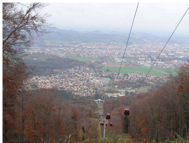
Kabinková lanovka Mariborskoje Pohorje, dole Maribor