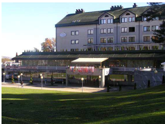
Hotel Habakuk – exteriér

Bez akreditačních karet jsme se v klidu dostali do vnitřních prostor, které vypadají velmi honosně. Až později jsem se od pana Kaňovského dověděl, že zde se budou odehrávat pouze zápasy U8+G8 a G10, ostatní kategorie budou odehrány ve druhém hotelu, resp jeho velké sportovní hale, vzdáleném cca 100